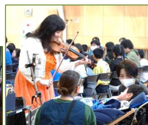
目の前で演奏に、うっとりしました。